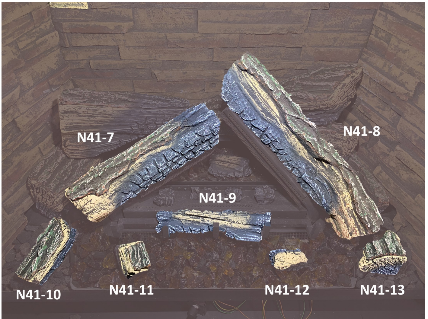
Figure 9.8 - Jeu de journaux 3