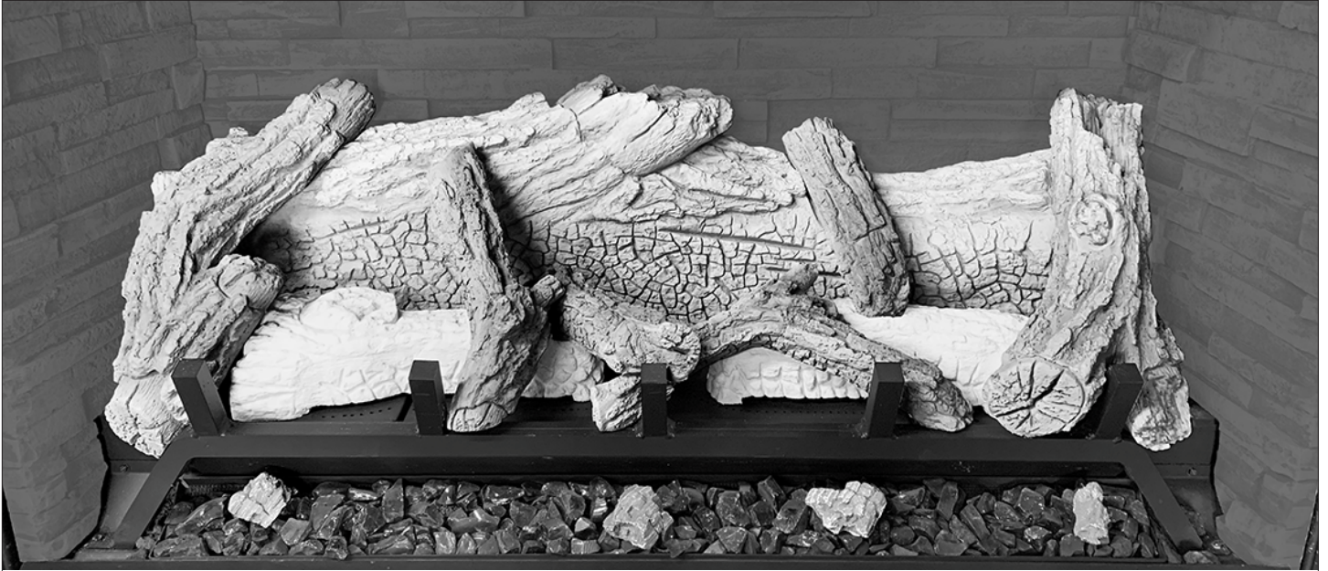
Figure 8.10, Installation finale du jeu de bûches n° BH44-500