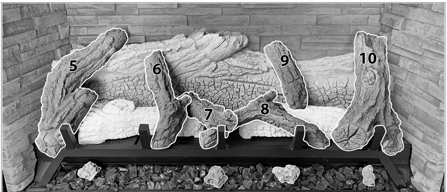
Figure 8.9, Bûches de haut