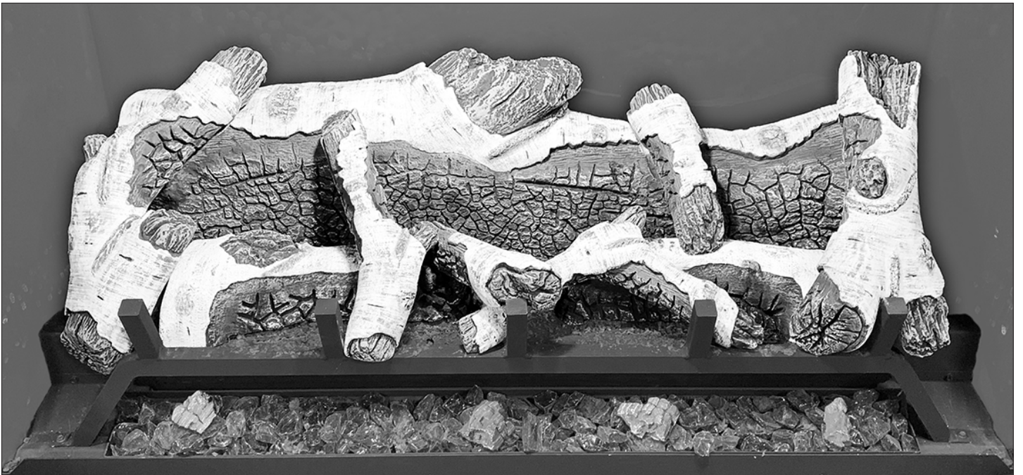
Figure 8.11, Installation finale du jeu de bûches n° BH44-B501