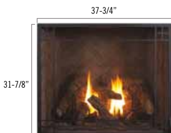
Façade arquée noire "Mission" avec écran protecteur, briques réfractaires traditionnelles et chenets en forme de cercle en option