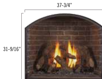
Façade déco-design arquée noire avec écran protecteur, briques réfractaires traditionnelles et chenets en forme de cercle en option